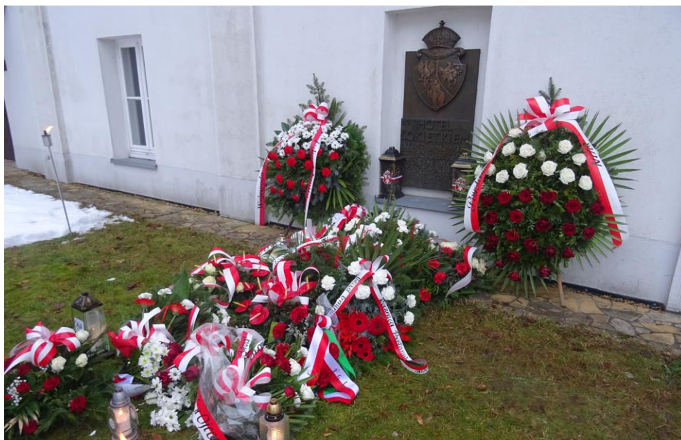
Ryc. 2. Wieńce pod tablicą poświęconą powstańcom styczniowym w Ojcowie.