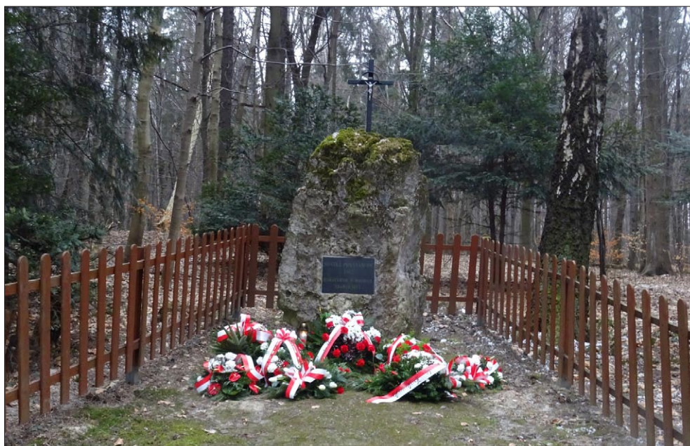
Ryc. 3. Mogiła powstańców styczniowych w Pieskowej Skale.