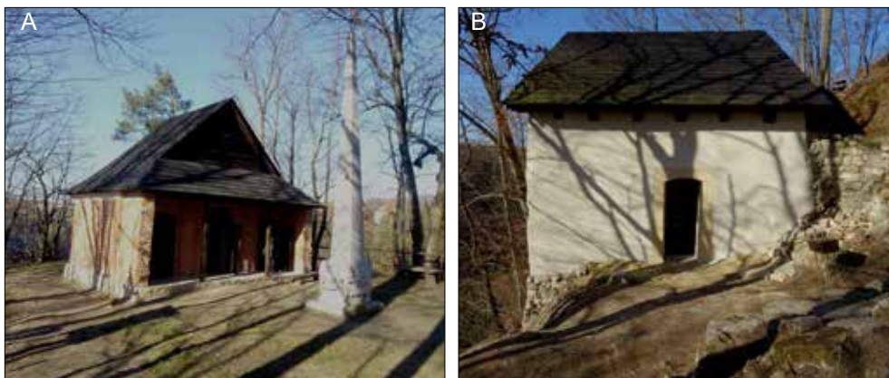
Ryc. 2. Odnowione obiekty w zespole dawnego konwentu sióstr Klarysek w Grodzisku: A – grotty pustelnicze, B – pustelnia bł. Salomei Piastówny

Fig. 2. Renovated objects in the complex of the former convent of the Poor Clares in Grodzisku: A – hermitage caves; B – the hermitage of Blessed Salomea