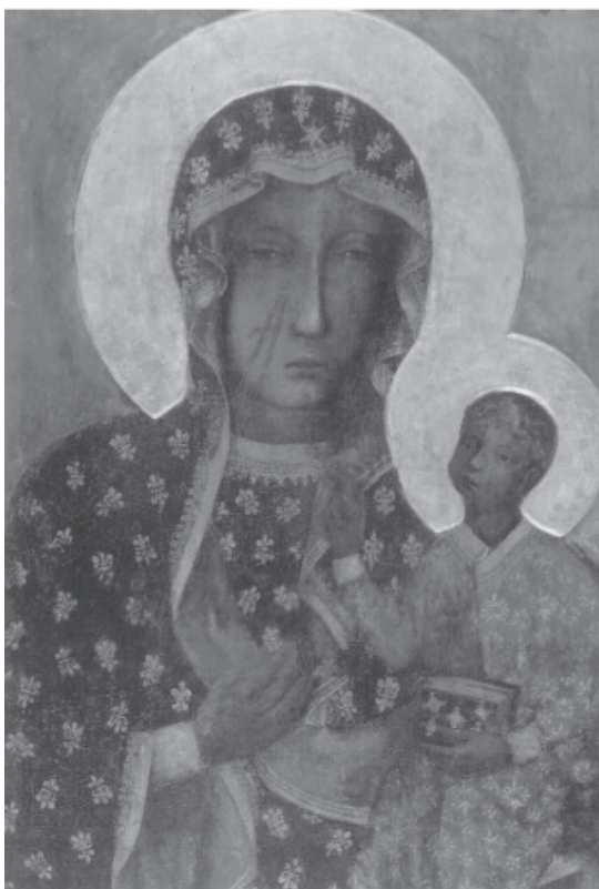
Ryc. 5. Matka Boska Częstochowska, obrazek dewocyjny