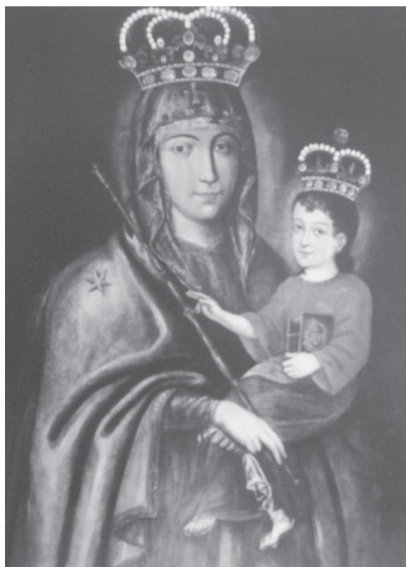
Ryc. 6. Matka Boża Lubaska, wg Rosikoń 2004, s. 255