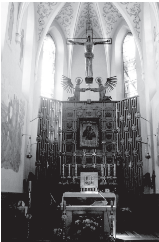
Ryc. 1. Wnętrze kościoła z cudownym obrazem Matki Bożej Smardzowickiej.