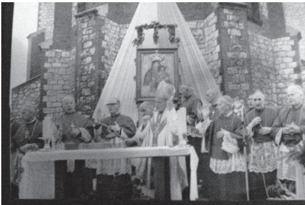
Ryc. 3. Uroczystość koronacji cudownego obrazu w 1972 r.