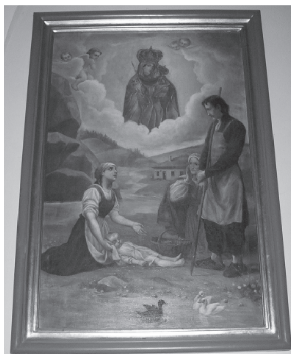
Ryc. 2. Przywrócenie życia utopionemu dziecku, obraz olejny w krużcu kościoła.

Fig. 2. Bringing child back to life, oil picture in church in Smardzowice.