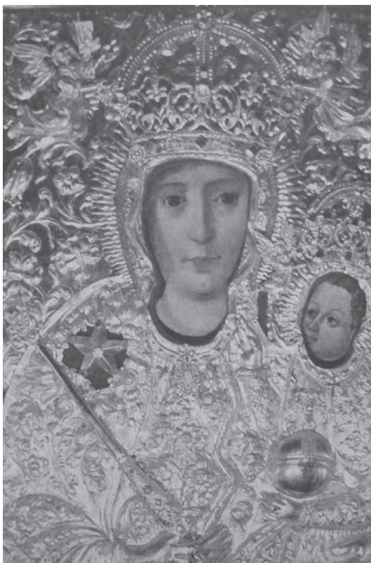
Ryc. 7. Matka Boża Brdowska, wg Rosikoń 2004, s. 45