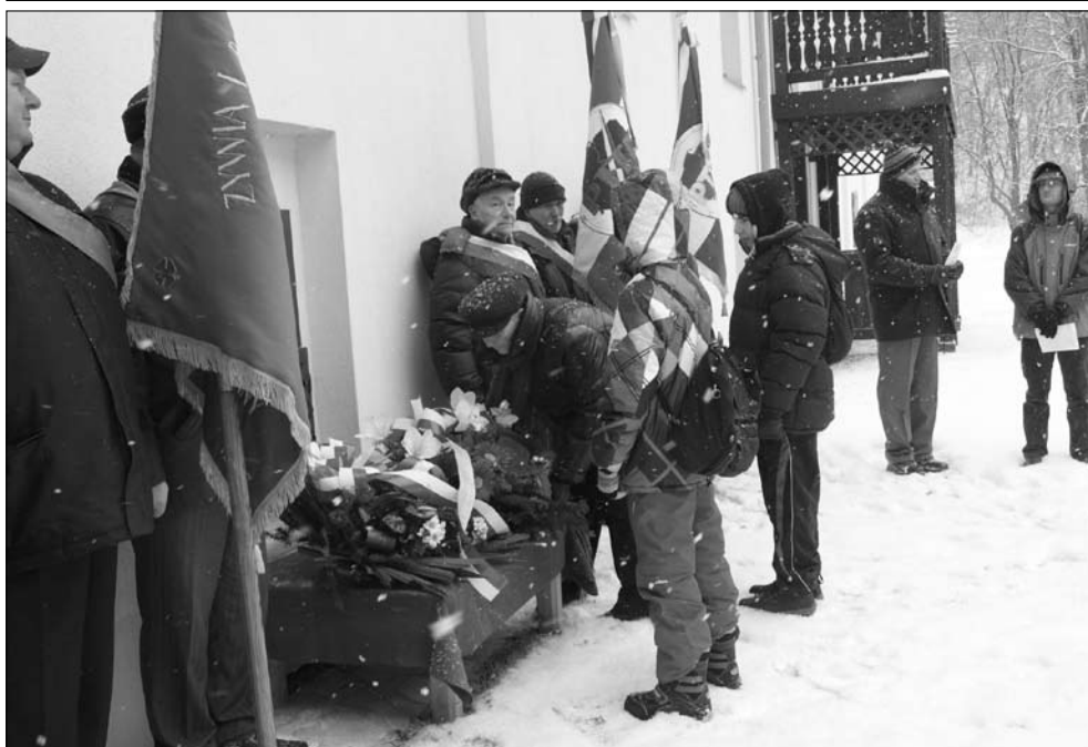
Ryc. 3, 4. Delegacje z kwiatami składanymi pod pamiątkową tablicą.