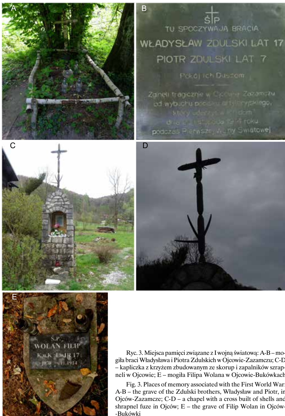
Ryc. 3. Miejsca pamięci związane z I wojną światową: A-B – mogiła braci Władysława i Piotra Zdulskich w Ojcowie-Zazamczu; C-D – kapliczka z krzyżem zbudowanym ze skorup i zapalników szrapneli w Ojcowie; E – mogiła Filipa Wolana w Ojcowie-Bukówkach