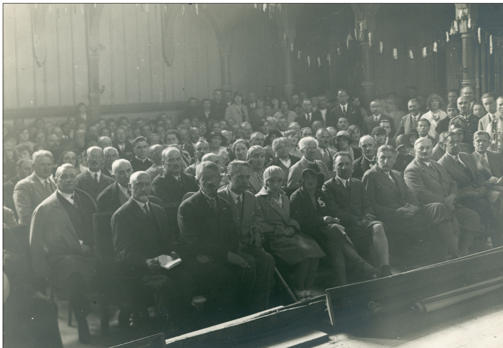
Ryc. 2. Otwarcie polskiego Parku Narodowego w Pieninach, Dom Zdrojowy w Szczawnicy, 31.08.1930 r.

Fig. 2. Opening of the Polish National Park in Pieniny, Spa House in Szczawnica, August 31, 1930. Archive of Science of the Polish Academy of Sciences and the Polish Academy of Arts and Sciences in Krakow