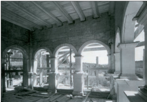
Ryc. 7. Rekonstrukcja loggii widokowej

Fig. 6. Exposed stone elements of the Renaissance observation loggia