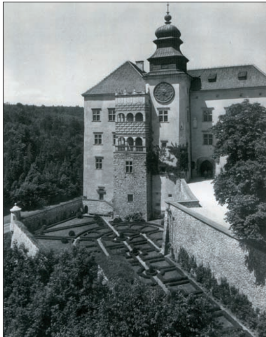
Fig. 8. Castle in Pieskowa Skala with the restored observation loggia, the projection (risalit) covered with a new dome and the reconstructed Renaissance gardens

Ryc. 9. Zamek w Pieskowej Skale ze zrekonstruowaną loggią widokową i ryzalitem nakrytym nowym hełmem oraz odtworzonymi ogrodami renesansowymi