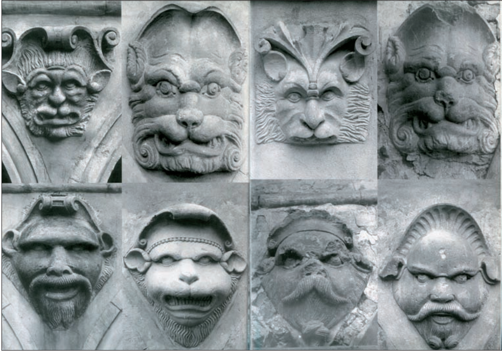
Ryc. 8. Odkryte maskarony z dziedzińca arkadowego