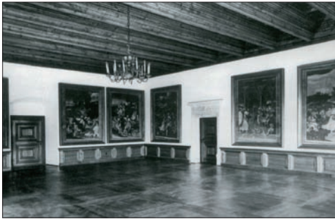
Ryc. 10. Jedna z komnat przywróconych do stanu z okresu świetności zamku

Inwentaryzacja architektoniczna zamku, jak i prowadzone nieco później bezpośrednie badania ujawniły, że niewiele pomieszczeń posiadało sklepienia. Ich budowa jest zadaniem stosunkowo skomplikowanym, a na dodatek wymaga sporych umiejętności budowlanych i czasu. Mając do dyspozycji sporą ilość drewna jaką bez trudu mogły dostarczyć lasy z terenu Doliny Prądnika, budowniczości zamku sprzed blisko pięciu wieków większość komnat i sal nakryli belkowanymi stropami drewnianymi. Jak świadczą o tym materiały archiwalne, przetrwały one w Pieskowej Skale stosunkowo długo, bo do I połowy XVIII w. Zniszczył je dopiero pożar zamku w 1718 r. Po odbudowie, zgodnie z ówczesną modą,