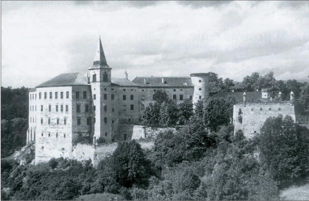
Ryc. 2. Zamek w Pieskowej Skale w okresie międzywojennym.