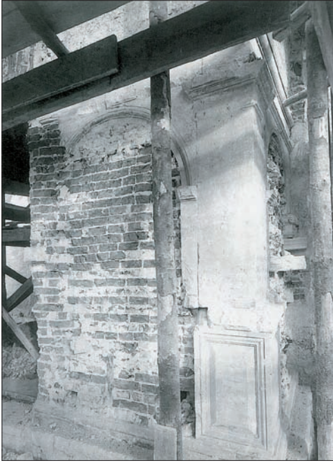
Ryc. 6. Odślonięte elementy kamienne renesansowej loggii widokowej

Fig. 6. Exposed stone elements of the Renaissance observation loggia