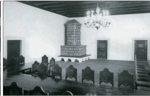
Ryc. 11. Komnata ze zrekonstruowanym stropem belkowanym i podłogą taflową

Fig. 10. One of the chambers restored to the state it was in at the time of the magnificence of the castle