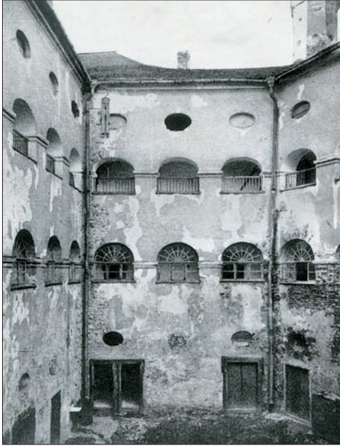
Ryc. 4. Dziedziniec arkadowy przed konserwacją Fig. 4. Arcaded courtyard before the restoration