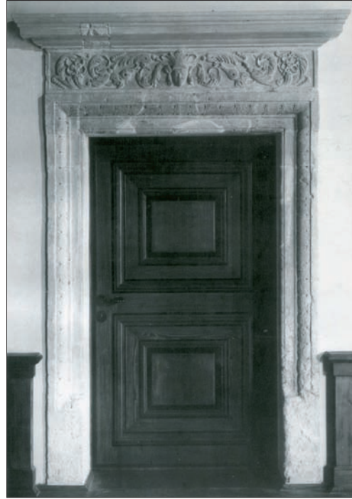
Ryc. 12. Jeden z renesansowych portali odkrytych podczas prac remontowych

Amfiladowy układ wewnątrz zamkowych, jak i ich kameralne rozmiary, przesądziły o przeznaczeniu zamku. Było oczywistym, że odnowiona budowla stanie się w przyszłości siedzibą placówki muzealnej, nie tylko z uwagi na wyjątkową wartość architektoniczno-historyczną obiektu, w jakim miała powstać i funkcjonować, ale i turystyczne walory Ojcowskiego Parku Narodowego, malowniczość Doliny Prądnika i położenie Pieskowej Skały na szlaku Orlich Gniazd wiodącego z Krakowa do Częstochowy. Niewielka odległość od dawnej stolicy Piastów i Jagiellonów oraz dawne związki dworu królewskiego z właścicielami Pieskowej Skały, zdecydowały o przeznaczeniu odrestaurowanej rezydencji Szafranców na oddział Państwowych Zbiorów Sztuki na Wawelu. Instytucja ta specjalizuje się w gromadzeniu regaliów i pamiątek związanych z władcami Polski, a także w odtwarzaniu wyglądu i wyposażenia komnat zamku królewskiego z czasów jego świetności. Jednakże – obok tego rodzaju muzealiów – posiada również wysokiej klasy dzieła sztuki, nie licujące jednak z charakterem dawnej rezydencji królewskiej. Dlatego też, po wyremontowaniu zamku w Pieskowej Skale trafiły tu liczne obrazy oraz dzieła sztuki zdobniczej, ilustrujące przemiany zachodzące w plastyce od średniowiecza po dwudziestolecie międzywojenne. Dzięki temu odnowiony zamek i jego komnaty wypełniły interesujące ekspozycje. Niewątpliwą atrakcją zamku jest także wspomniana już, unikatowa w Polsce, Galeria Malarstwa Angielskiego.