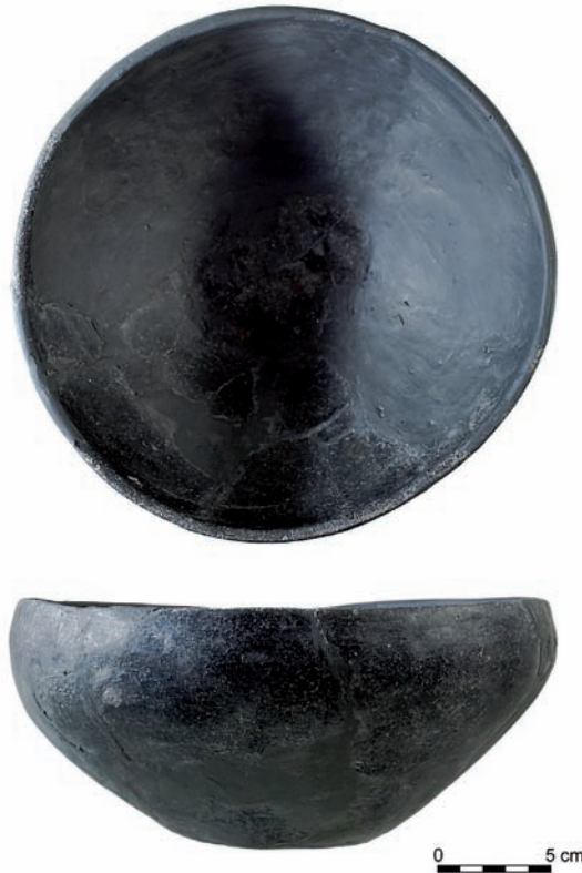
Ryc. 3. Pokrywa popielnicy kultury łużyckiej z Sąspowa.