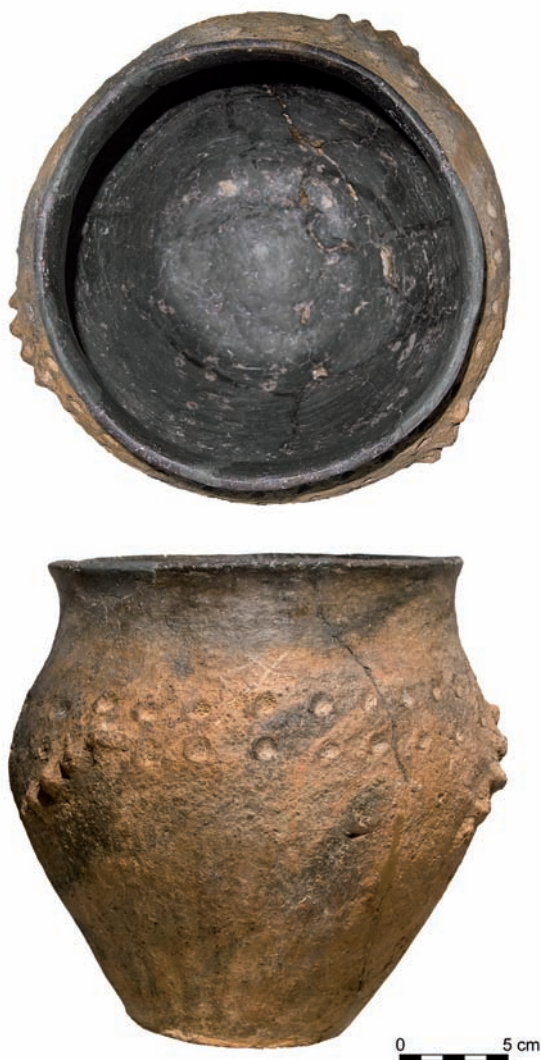
Ryc. 2. Popielnica kultury lużyckiej z Sępowa.

Fig. 2. Cinerary urn and the cover of the cinerary urn of the Lusatian culture from Sępów.