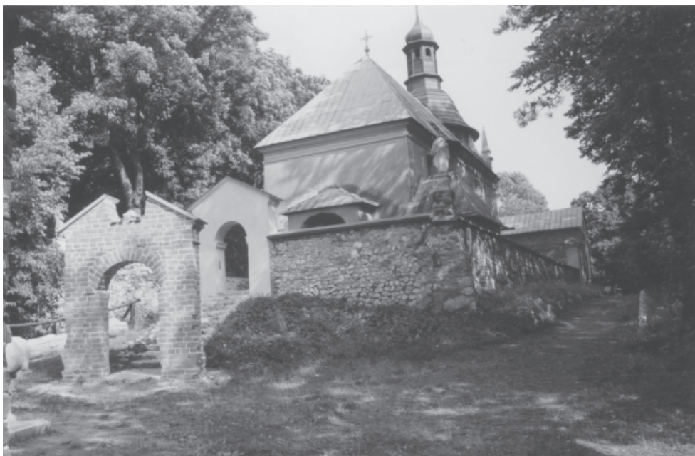
Ryc. 11. Pustelnia bł. Salomei w Grodzisku koło Skały. Widok ogólny od pd.-zach. z terenu II członu założenia na kościół i otaczający go mur z bramką (C); na pierwszym planie schody i bramka (D) prowadzące na teren II członu założenia z budynkiem trzech kaplic; w głębi widoczny fragment domu dla kapelana.

Fig. 11. Hermitage of Blessed Salomea in Grodzisko near Skała. A panoramic view from the south-east, from the area of module II of the layout towards the church and the surrounding wall with the gate (C). In the foreground the steps and the gate (D) leading to the area of module II of the layout with the building of three chapels. In the background the fragment of the house for a chaplain.