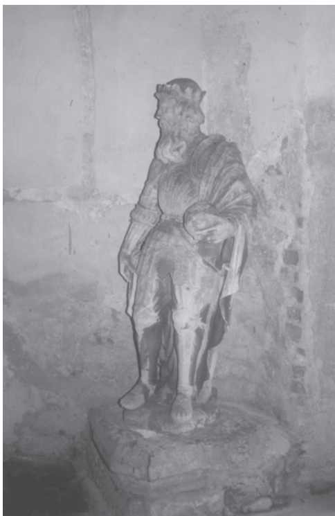
Ryc. 10. Pustelnia bł. Salomei w Grodzisku koło Skały. Renesansowy posąg króla Dawida z około 1528 r. z Kaplicy Zygmuntowskiej na Wawelu, przeniesiony do Grodziska jako personifikacja Henryka Brodatego, ustawionego na murze „Cmentarza”; stan przed konserwacją; obecnie oryginał rzeźby przekazanej do Muzeum Zbiorów Sztuki na Wawelu, zastąpiono odlewem. Fot. Z. Holcer, 2002

Fig. 10. Hermitage of Blessed Salomea in Grodzisko near Skała. The Renaissance statue of King David from around 1528 moved to Grodzisko from Sigismund's Chapel at Wavel Castle and placed on the wall of the Graveyard as the personification of Henry the Bearded; the state before conservation. The statue was replaced with a cast after returning the genuine sculpture to the State Museum of Art Collections at Wavel. Photo by Z. Holcer, 2002