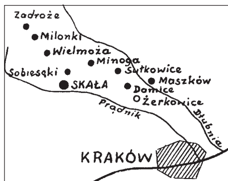
Ryc. 3. Posiadłości klasztoru Klarysek w XIII i XIV w. w Dolinie Prądnika i Dłubni wg. J. Stoksik (1961)