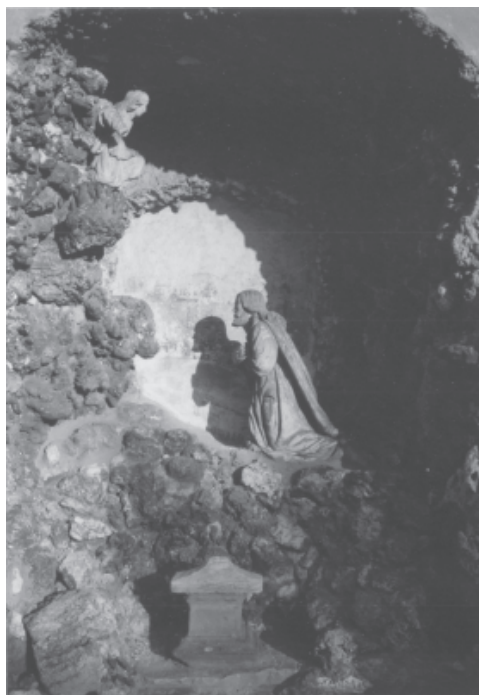
Ryc. 8. Pustelnia bł. Salomei w Grodzisku koło Skały. Ogrojec usytuowany na zewnątrz prezbiterium kościoła, ukształtowany w formie sztucznej groty-jaskini, z kłęczącą postacią Chrystusa; dzieło Kazimierza Kaliskiego z 1688r. Fot. Z. Holcer, 2002

Fig. 7. Hermitage of Blessed Salomea in Grodzisko near Skała. The fragment of the interior of the church's nave; below the cornice of the vault visible painted candlesticks of the former chapel connected with its consecration in 1642; in the lower part of the corner visible traces of the side altar setting. The altar was removed during the conversion of the chapel into the church in the 1690 s. Photo by Z. Holcer, 2003