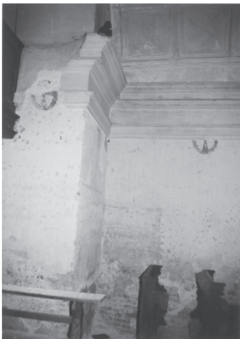
Ryc. 7. Pustelnia bł. Salomei w Grodzisku koło Skały. Fragment wnętrza nawy kościoła; poniżej gzymsu sklepienia widoczne malowane zacheuszki dawnej kaplicy związane z jej konsekracją w 1642 r.; w dolnej partii narożnika ślad usytuowania ołtarza bocznego, zlikwidowanego przy adaptacji kaplicy na kościół w latach 90. XVII w.

Fig. 7. Hermitage of Blessed Salomea in Grodzisko near Skała. The fragment of the interior of the church's nave; below the cornice of the vault visible painted candlesticks of the former chapel connected with its consecration in 1642; in the lower part of the corner visible traces of the side altar setting. The altar was removed during the conversion of the chapel into the church in the 1690 s.