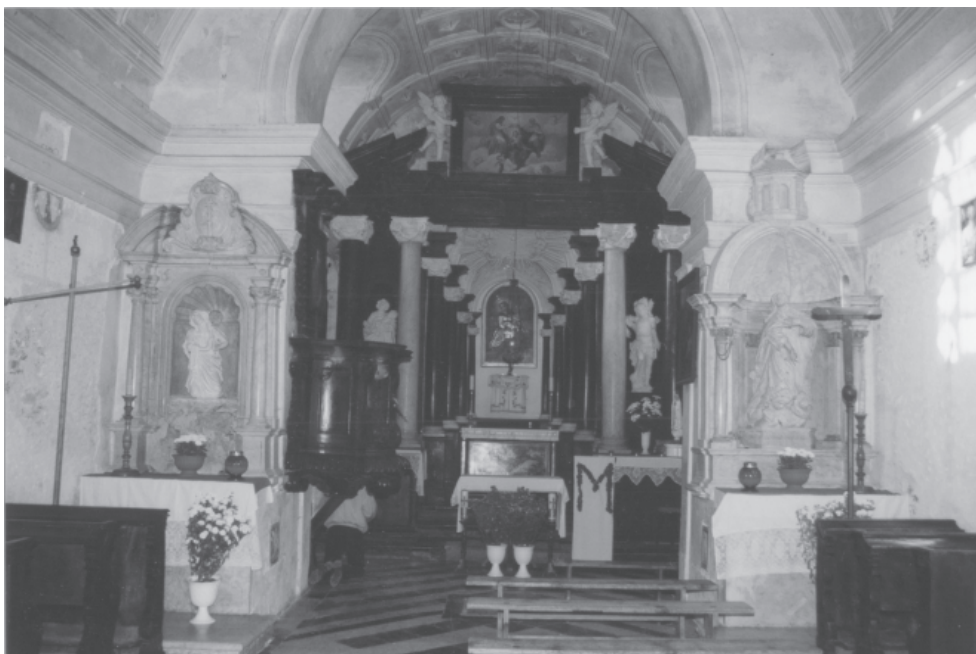
Ryc. 9. Pustelnia bł. Salomei w Grodzisku koło Skali. Wnętrze kościoła, widok w kierunku ołtarza głównego; na pierwszym planie w nawie ołtarze boczne: po prawej – bł. Salomei, po lewej- św. Marii Magdaleny, pierwotnie – Krzyża Świętego. Fot. Z. Holcer, 2002

Fig. 9. Hermitage of Blessed Salomea in Grodzisko near Skala. The interior of the church, a view towards the main altar; in the foreground located in the nave side altars: to the right the altar dedicated to Blessed Salomea, to the left the altar originally dedicated to the Holy Cross, now to Saint Mary Magdalene. Photo by Z. Holcer, 2002