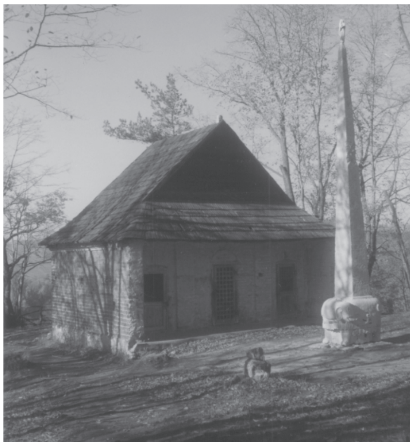
Ryc. 12. Pustelnia bł. Salomei w Grodzisku koło Skały. Budynek z trzema kaplicami poprzedzony rzeźbą słonia dźwigającego obelisk zwieńczony rzeźbą Matki Boskiej (II człon założenia). Fot. Z. Holcer, 1999

Fig. 12. Hermitage of Blessed Salomea in Grodzisko near Skała. The building housing three chapels and in front of it the sculpture of an elephant carrying an obelisk crowned by the statue of Mother of God (module II of the layout). Photo by Z. Holcer, 1999