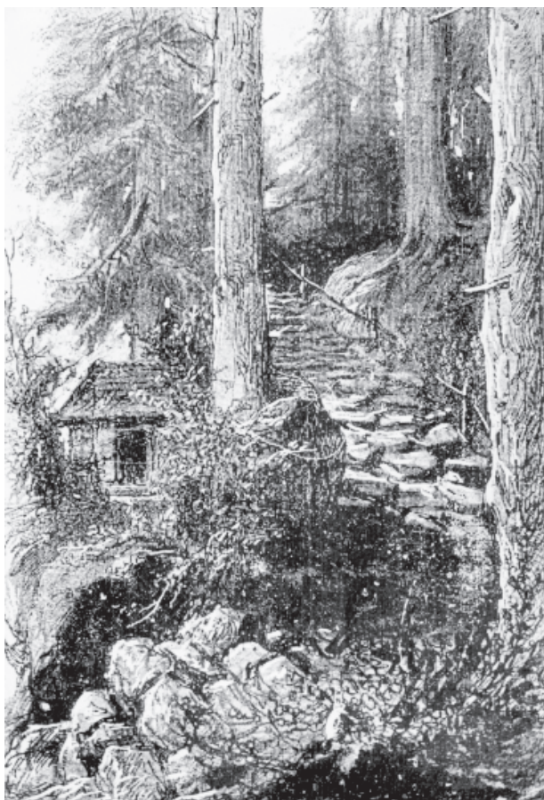
Fig. 14. Hermitage of Blessed Salomea in Grodzisko near Skała. The steps so-called “The Rosary Steps” leading down the slope to the Hermitage of the Blessed (module III of the layout). The engraving according to the drawing by M. Andriolli, [in:] „Kłosy”, 1887, no 1154, p. 93

cowych łączyło się z wątkiem mariologicznym występującym w obrębie wszystkich członów założenia i wiązało się ze szczególnym nabożeństwem bł. Salomei do Matki Boskiej, która miała się jej ukazać przed śmiercią 59 .