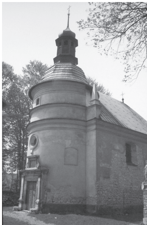
Fig. 4. Hermitage of Blessed Salomea in Grodzisko near Skała. The church – the frontal view after the conducted in the 1670s–1690s conversion of the older chapel from 1642; below the cornice visible fragments of a painting once decorating the apse of the former chapel and a stony motif of its north wall [module I of the layout].

Ryc. 4. Pustelnia bł. Salomei w Grodzisku koło Skały. Kościół – widok od frontu po adaptacji w latach 70–90. XVII w. starszej kaplicy z 1642 r.; poniżej gzymsu widoczne fragmenty dekoracji malarskiej absydy dawnej kaplicy oraz kamienny wążek jej ściany północnej (I człon założenia).