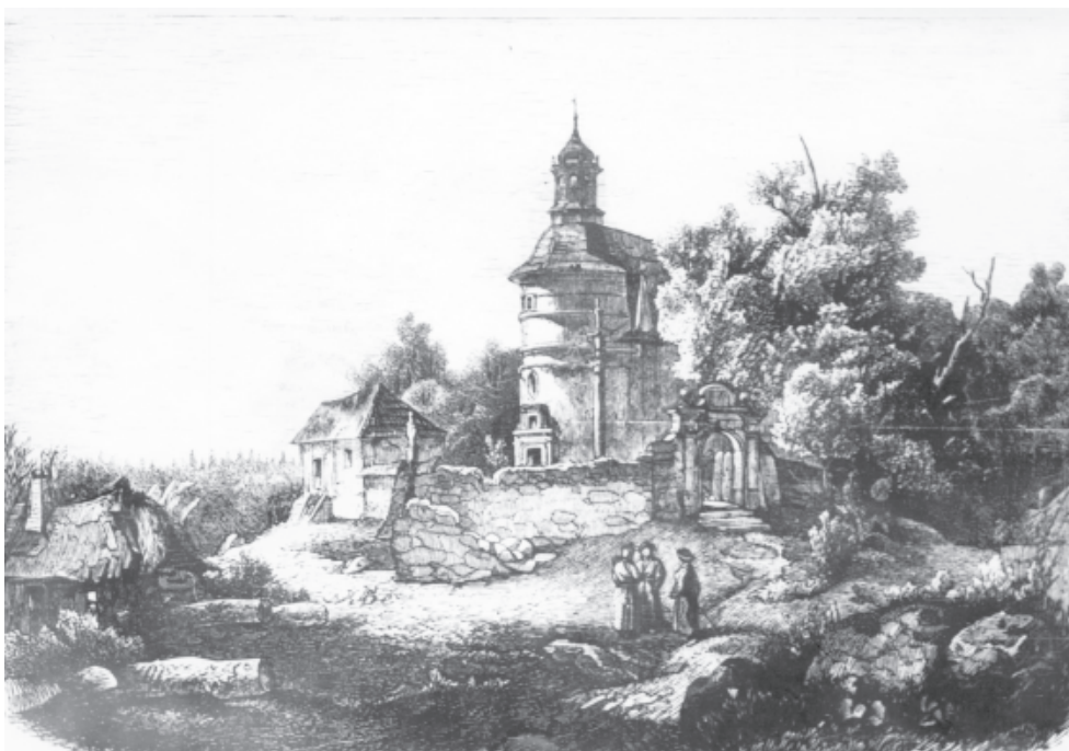
Ryc. 15. Pustelnia bł. Salomei w Grodzisku k. Skały. Widok od pn.-wsch. na kościół i otaczający teren przykościelny tzw. Cmentarz z główną bramką wejściową (A) oraz domem dla kapelana (tzw. Kapelanka). Drzeworyt wg rys. H. Dziarkowskiego, [w:] „Tygodnik Ilustrowany”, 1861 r., nr 99, s. 61

Fig. 15. Hermitage of Blessed Salomea in Grodzisko near Skała. A view from the north-east towards the church and the surrounding square, so-called Graveyard, with the main entrance gate (A) and the house for a chaplain (so-called Chaplain's House). The engraving according to the drawing by H. Dziarkowski, [in:] „Tygodnik Ilustrowany”, 1861, no 99, p. 61