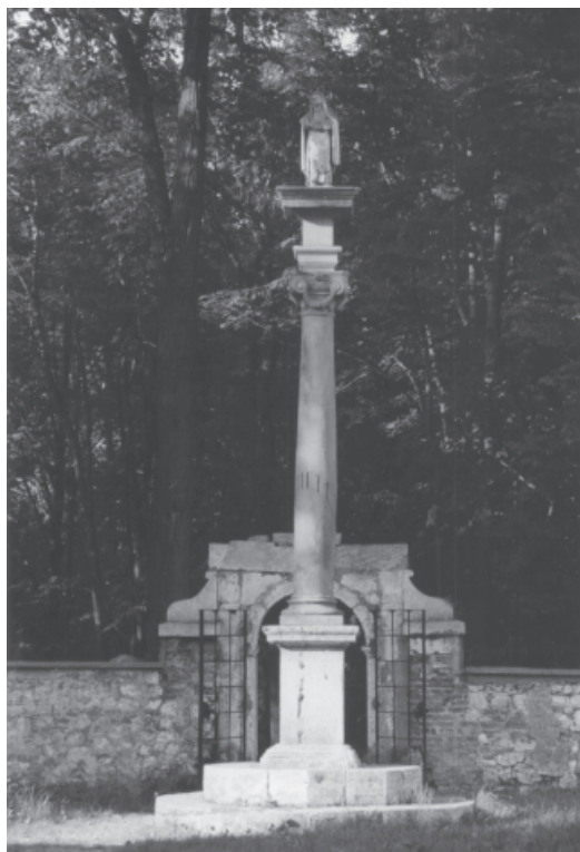
Fig. 6. Hermitage of Blessed Salomea in Grodzisko near Skała. The column with the sculpture of Saint Kinga which originally had the figure of Blessed Salomea. The column rises on the small church square situated behind the main gate (A) in the wall surrounding the so-called Graveyard (module I of the layout). Photo by Z. Holcer, 2002

Ryc. 6. Pustelnia bł. Salomei w Grodzisku koło Skały. Kolumna z rzeźbą, pierwotnie błogosławionej Salomei, obecnie św. Kingi, wzniesiona na terenie niewielkiego dziedzińca przed kościołem, za główną bramką (A) w murze otaczający teren przykościelny – tzw. Cmentarz (I człon założenia). Fot. Z. Holcer, 2002