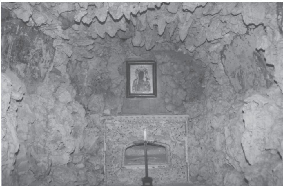
Ryc. 13. Pustelnia bł. Salomei w Grodzisku koło Skały. Kaplica środkowa p.w. Zaśnięcia NMP (II człon założenia). Wnętrze ukształtowane w formie sztucznej groty-jaskini z symbolicznym „pustym” grobem pod mensą ołtarza. Fot. Z. Holcer, 2002

Fig. 13. Hermitage of Blessed Salomea in Grodzisko near Skała. The middle chapel dedicated to the falling asleep of the Blessed Virgin Mary (module II of the layout). The interior made in the form of a cave with a symbolic “empty tomb” under the mensa of the altar. Photo by Z. Holcer, 2002