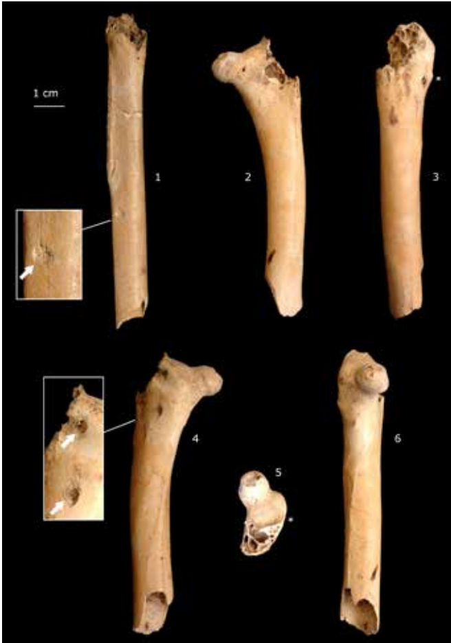
Ryc. 1. Odkryte na zamku w Ojcowie szczątki pawia Pavo cristatus Linnaeus, 1758 (wykop I/2006, warstwa 4). 1 – Trzon lewej kości piszczelowo-stępowej (tibiotarsus) w rzucie tylnym. 2-6 – Bliższy fragment lewej kości udowej (femur) w rzucie przednim (2), bocznym (3), tylnym (4), odczaszkowym (5) i odśrodkowym (6). Gwiazdki (*) wskazują cechy diagnostyczne kości (por. Tomek, Bocheński 2009: 57, 59); strzałki pokazują ślady gryzienia. Oprac. graficzne i fot. Krzysztof Wertz.