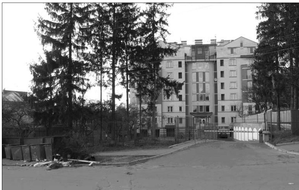
Ryc. 4. Wielopiętrowa zabudowa mieszkalna na obrzeżach parku. Fot. 4. Multi-storey buildings on the edges of the Park.