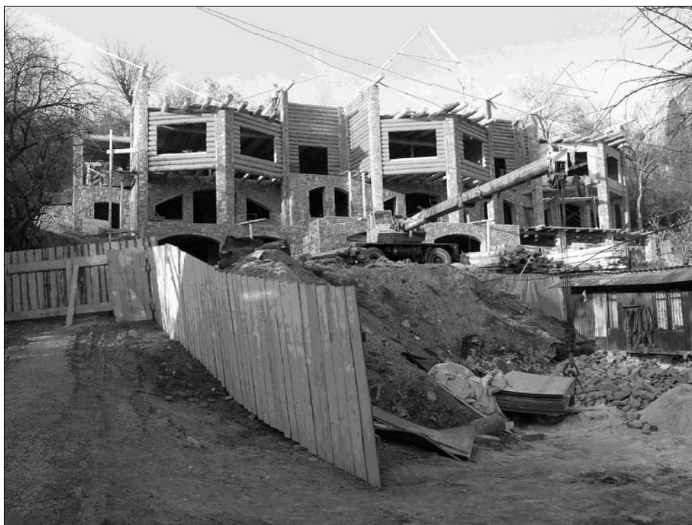
Ryc. 2. Nielegalna zabudowa na terenie parku.

W ciągu ostatnich lat, z powodu braku miejsc pod budownictwo w centrum miasta, zagrożenie dla Parku i jego strefy ochronnej zaczęła stanowić aktywna ekspansja mieszkaniowa (ryc. 2, 3, 4). W pierwszej kolejności dotyczy to budowy domów jednorodzinnych (ul. Lypnykiwskiego, Staroznesienska, Lisowa) znajdujących się w obrębie Parku, a także wielopiętrowego budownictwa na peryferiach Parku (ul. Dowbusza, Niżyńska). Bez jakichkolwiek zezwoleń ze strony Parku powstają obiekty gastronomiczne (ul. Lisowa) i parkingi przy ul. Charkowskiej. Budownictwo jest wprowadzane z naruszeniem wszelkich przepisów obowiązujących w Parku, i co więcej – z wyraźnym przekształceniem rzeźby w obrębie Parku (podcinanie stoków, powstawanie zagłębień), niszczeniem pokrywy roślinnej oraz wypaczeniem poprzez budownictwo wielopiętrowe istniejącego tam stylu architektonicznego (ryc. 4). Mimo wielu działań zapobiegawczych podejmowanych przez administrację Parku, wzrasta ogólny poziom zaśmiecenia jego obszaru. Szczególnie duża ilość śmieci widoczna jest w miejscach wypoczynku w okresie weekendu. Liczba dzikich wysypisk śmieci wzrasta również na obrzeżach Parku, co związane jest zarówno z urządzaniem tu miejsc wypoczynku jak też z działalnością mieszkańców sąsiednich