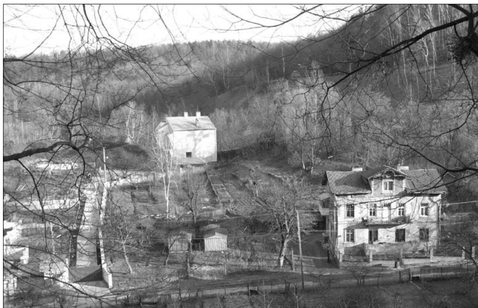
Ryc. 3. Ekspansja budownictwa mieszkaniowego na teren parku. Fig. 3. Expansion of residential buildings within the Park.